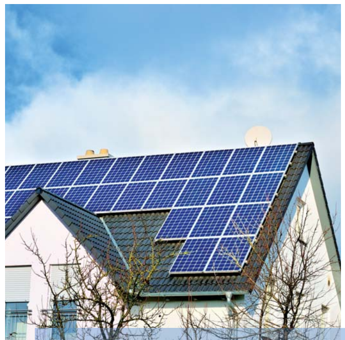
Das Projekt „daheim Solar“ ermöglicht die Photovoltaikanlage auf dem eigenen Hausdach mit Batteriespeicher

Ein Angebot der Gemeindewerke, das Energieberater Müller organisiert, ist dabei die Abwicklung zur Förderung für die gesamte Maßnahme von der Antragstellung bis hin zur Auszahlung der Fördergelder über die Gemeindewerke durchzuführen. „Da sind einige Sachverständigenbestätigungen vonnöten und auch die ordnungsgemäße Bauausführung muss nach der Maßnahme dokumentiert werden, das können wir alles anbieten, wenn es vom Kunden gewünscht ist.“