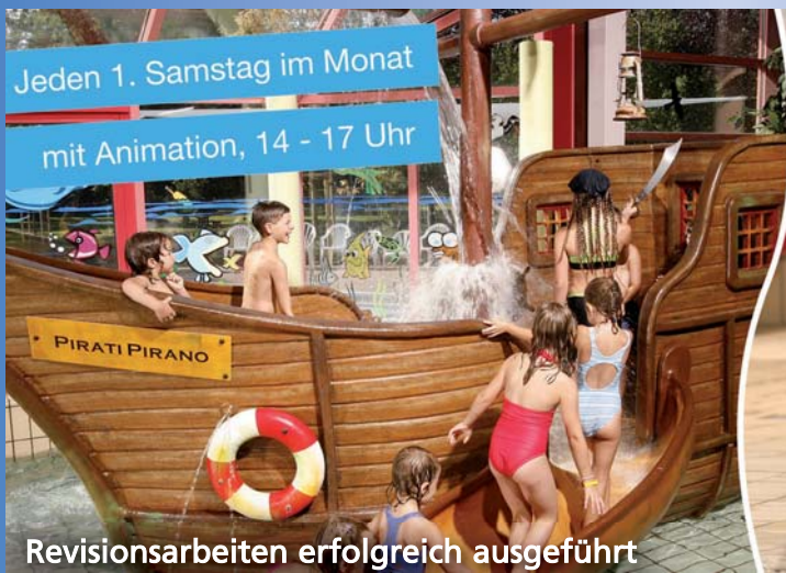
Revisionsarbeiten erfolgreich ausgeführt