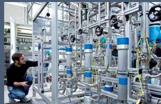
Eine Power-to-Gas-Forschungsanlage mit 250 Kilowatt elektrischer Eingangsleistung am Zentrum für Sonnenenergie- und Wasserstoff-Forschung Baden-Württemberg (ZSW)

werden kann. „Wir wollen die Anlage für die Dauer eines Demonstrationbetriebes so einbinden, dass sie aktiv dazu beiträgt, die Unterschiede zwischen Stromerzeugung aus erneuerbaren Energien und Stromverbrauch auszugleichen“, heißt es in einer Stellungnahme der Thüga AG. Die Demonstrationsanlage der Thüga Strom zu Gas-Projektplattform wird vom hessischen Ministerium für Wirtschaft, Energie, Verkehr und Landesentwicklung sowie der Europäischen Union gefördert.